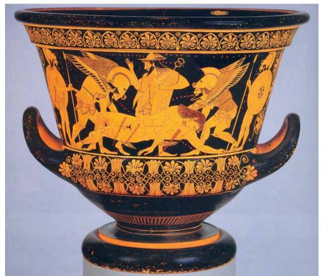
Εικόνα 1. Ο Ύπνος και ο Θάνατος, που εικονίζονται σαν φτερωτά όντα, παίρνουν τον Σαρπηδόνα και πηγαίνουν να τον θάψουν στην Κιλικία. Στο μέσο ο ψυχοπομπός Ερμής. Κρατήρας του Ευφρονίου, 5 ος αιώνας π.Χ., πρώην Μητροπολιτικό Μουσείο Νέας Υόρκης. (Βλέπε και Κ Π Καβάφη, Η Κηδεία του Σαρπηδόνα: http://www.kavafis.gr/poems/content.asp?id=154&cat=1 )

το θάνατο». Ο Πυθαγόρας πάλι λέει ότι «χάριν εκείνων για τα οποία θέλεις να ζεις, χάριν τούτων μη διστάζεις και να