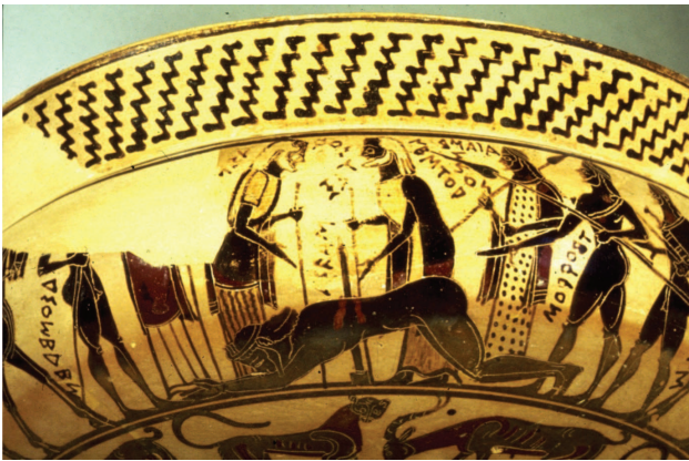
Εικόνα 3. Η αυτοκτονία του Αϊάντα. Κορινθιακή Κύλιξ, περίπου 580 π.Χ.

αποθάνεις». Αυτό είναι και η βάση όλων των μαρτύρων του χριστιανισμού οι οποίοι αποφασίζουν κάποια στιγμή ότι θέλουν να πεθάνουν για την πίστη τους, ή των στρατιωτών οι οποίοι πεθαίνουν για την πατρίδα τους. Τα άτομα και των δύο ομάδων όχι μόνο δεν τιμωρούνται αλλά είτε αγιάζουν είτε ηρωοποιούνται.