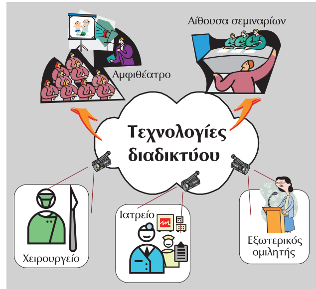
Εικόνα 2. Σενάρια τηλεμετάδοσης για την υποστήριξη διδασκαλίας της ιατρικής πράξης από μακριά.

Κλασικά, παρόμοιες εφαρμογές τηλεμετάδοσης γίνονται με βάση εξειδικευμένες τεχνολογίες και δικτυακές γραμμές (συνήθως αποκλειστικές πολλαπλές τηλεφωνικές συνδέσεις μεταξύ των συμβαλλόμενων μερών). Με την εξέλιξη όμως της ταχύτητας στη δικτυακή υποδομή του διαδικτύου και την παράλληλη ανάπτυξη των σχετικών τεχνολογιών προωθείται, σήμερα, η ανάπτυξη εφαρμογών τηλεμετάδοσης μέσα από το διαδίκτυο. Χαρακτηριστικό παράδειγμα από τον ελληνικό χώρο είναι η προσπάθεια για αναμόρφωση του προπτυχιακού προγράμματος σπουδών στο Τμήμα Ιατρικής του Δημοκρίτειου Πανεπιστημίου Θράκης, όπου μεταξύ άλλων χρησιμοποιούνται τεχνολογίες διαδικτύου για τη σύγχρονη με-